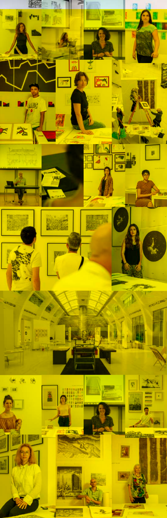
FIG BILBAO 2020 FESTIVAL INTERNACIONAL DE GRABADO Y ARTE SOBRE PAPEL DE BILBAO

Director Open Portfolio David Arteagoitia